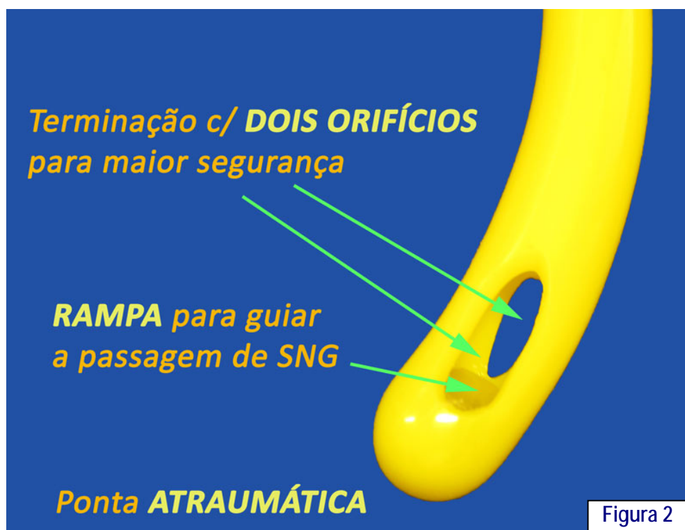
(Figura 2) Ponta distal atraumática, maciça e arredondada, para facilitar a inserção.